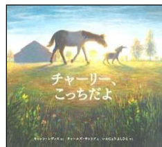
8月 チャーリー、こっちだよ キャレン・レヴィス／さく チャールズ・サントソ／え いわじょう よしひと／やく BL出版 2020年 ¥1700

うろおぼえ一家 いっか は、お父 とう さんにお母 かあ さん、お兄 にい さん、弟 いもうと 、妹 せむい の全員 ぜんいん が、何 なに から何 なに までうろおぼえな、あひるの家族 かぞく 。買い物 か に出 い かけても、何 なに を買 か うのかうろおぼえ。四角 しかく いものだったような…豆腐 とうふ ？いや、もっと重 おも いもので、しまるし、冷 つめ たいし、光 ひか る？そんなもの、あるのでしょうか？一家 いっか はいったい何 なに を買 か いたかったのでしょうか？