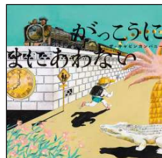
10月 がっこうにまにあわない ザ・キャビンカンパニー／作・絵 あかね書房 2022年 ¥1500

3階 かいだ 建ての7つのお部屋 へや の1日 いちにち が始 はじ まります。朝 あさ 、パン屋 や のおじさんはパンの準備 じゆん 、時計職 とけいしやくにん 人 にん のおじいさんはお散歩 さんぽ へ。まだ起 お きていない人もいます。朝 あさ 6時から翌 あす 朝 あさ 5時まで、時間 じかん ごとにみんなの1日 いちにち を見てみましょう。同じ1日 いちにち でもみんなそれぞれ。細 こま かい切り絵 かぎ なので見るたびに発見 はっけん がありそう。おまけのクイズもあります。