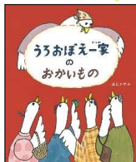
5月 うろおぼえ一家のおかいもの 出口 かずみ／作 理論社 2021年 ¥1300

髪 かみ の長い女 おんな の子 こ の隣 となり のページには、二匹 にひき のちょうちやがいます。白い鳥 しろとり の隣のページには、赤い実 あかみ のなっている木 き が。「のせのせ せーの！」でめくったら、ちょうちやはリボンに、赤い実と葉 は は鳥 はね の羽 う に…。ページをめくると左右 さゆう の絵 え に変化 へんか が起こり、めくるのが楽しくなる絵本 えほん です。何がどう変身 へんしん するのか、めくる前に予想 よそう するのも楽しそう。