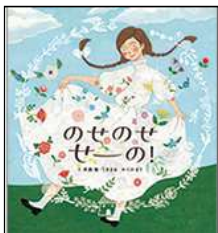
4月 のせのせせーの！ 斉藤 倫／文 うきまる／文 くの まり／絵 ブロンズ新社 2022年 ¥1500

髪 かみ の長い女 おんな の子 こ の隣 となり のページには、二匹 にひき のちょうちやがいます。白い鳥 しろとり の隣のページには、赤い実 あかみ のなっている木 き が。「のせのせ せーの！」でめくったら、ちょうちやはリボンに、赤い実と葉 は は鳥 はね の羽 う に…。ページをめくると左右 さゆう の絵 え に変化 へんか が起こり、めくるのが楽しくなる絵本 えほん です。何がどう変身 へんしん するのか、めくる前に予想 よそう するのも楽しそう。