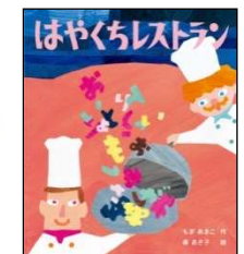
11月 はやくちレストラン もぎ あきこ／作 森 あさ子／絵 金の星社 2021年 ¥1300

7時47分 7じ47ぶん 。げんかんをとび出し、ゴウゴウと走りだした男 おとこ の子 こ 。今日 けふ はぜったい8時 8じ までに学校 がっこう に行 い かなくてはならないのです。しかし、行 い く手 て には次々 つぎつぎ と障害 しょうがい が…。ダイナミックなイラストと、1分単位 1ぶんたんたい で進むページに、はらはらドキドキがとまりません。はたして男 おとこ の子 こ は、ぶじ学校 がっこう に間に合 あ うのか！？