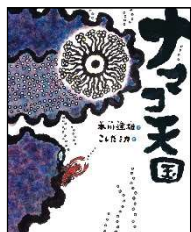
6月 ナマコ天国 本川 達雄／作 こしだ ミカ／絵 偕成社 2019年 ¥1600

ミニチュア ミニチュア の作業員 さぎょういん たちが、見 み なれた日用品 にちようひん を分解 ぶんかい して別 べつ のものを作り つく ます。せんたくばさみはブランコに、ハブラシは街灯 がいとう に、メガネはプールに。そしてすてきな街 まち が出来 でき 上がるのです。作者 さくしや の想像力 そうぞうりよく に驚 おどろ かされます。「見 み 立て」のおもしろさで、新 あたら しくものを「組 くみ み立て たて 」る本 ほん です。あなたもこの世界 せかい をのぞいてみませんか。