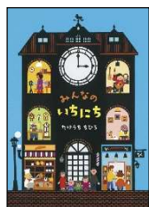
7月 みんなのいちにち たけうち ちひろ／作 アリス館 2021年 ¥1500

ギュッて握 にぎ ったらカチンコチン かた に硬 かた くなって、ゴシゴシこするとドロドロに溶 と けてしまう。でも、溶 と けても数週 すうしゅうかん 間 かん たてば元 もと 通りに戻 もど るし、真 ま っ二つに切 き っても二匹 にひき に増 ま えるだけ。そんな不死身 ふししん の生き物 いきもの なんている？その正体 せいたい は…ナマコ！びっくりな秘密 ひみつ がもりだくさんで、ナマコの魅力 みりょく にはまってしまふこと間違 まちが いなしの科学 かがく 絵本 えほん 。