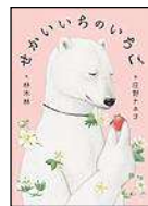
林 木林/作 庄野 ナホコ/絵 小さい書房 2018年 ¥1800

ある日シロクマの元に届いた一粒のいちご。生まれて初めてのいちごに大興奮！でもいちごは毎年届くようになり、しかも年々数も増えて…。慣れることによって忘れかけていたものに気付いてドキリとします。