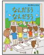
ヨシタケ シンスケ/著 光村図書出版 2019年 ¥1500

哲学的だけど、ふと考えてしまう身近な疑問について、ヨシタケ流に解釈していく。同じ問いに対して自分はどうか考え、また他の人とはどう違っているのだろうか。話し合えば、きっと自分一人では思いもよらない考えに出合えるかもしれないね。