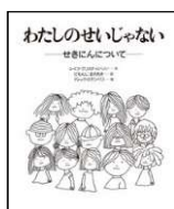
レイフ・クリスチャンソン/文 にもんじ まさあき/訳 ディック・ステンペリ/絵 岩崎書店 2017年 ¥1800

学校の教室で泣いている男の子がいます。みんなは「みてるだけ」だったり「みんながやったから」と言い訳しますが…。無責任や無関心は何を生むのでしょうか。いじめ問題を考える絵本。1996年刊の大型版。