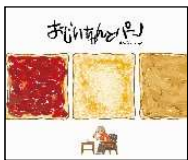
たな/え・ぶん パイインターナショナル 2017年 ¥980

食パンに甘いものを塗って食べるのが大好きなおじいちゃんと、そんなおじいちゃんが大好きな孫の「ちびすけ」。おじいちゃんが食べるパンは、どれもおいしそうなものばかり。おうちで真似して作ってみてください。