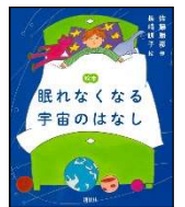
佐藤 勝彦/作 長崎 訓子/絵 講談社 2016年 ¥1500

宇宙はどこまで続くのだろう、どうやってできたのだろう…。謎が多く魅力的な“宇宙”という存在。古代エジプトから現代まで、天文学の歴史がわかりやすく描かれています。今夜は眠れなくなるかも。元になった書籍も併せてどうぞ。