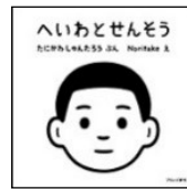
たにかわ しゅんたろう/ぶん Noritake/え ブロンズ新社 2019年 ¥1200

道後に住む飼い猫マルは新しく家に来たメス猫にやきもちを焼いて家出。ひょんなことから県内各地を回って冒険することに！松山在住の早見さんと今治出身のかのうさんがタッグを組んだ『愛媛新聞』土曜日版に連載されている作品の書籍化。