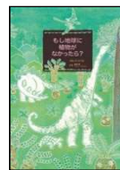
きねふち なつみ/作 真鍋 真/監修 ジョン・フルタン/監修 あすなろ書房 2019年 ¥1500

自分は、自分より大きなだれかのかげらだと思っているはぐれくん。そのだれかが通りかかるとを待っていたとき、おおきなマルがあらわれて…。理想の自分や、人との関係に悩んだときに読みたいお話です。