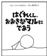
シエル・シルヴァスタイン/作 村上 春樹/訳 あすなろ書房 2019年 ¥1500