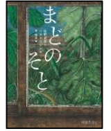
佐野 史郎/作 ハダ タカヒト/絵 東 雅夫/編 岩崎書店 2019年 ¥1500

怪談のエキスパート・東雅夫編集「怪談えほん」シリーズの一冊。風もなく地震でもないのに、かたかたかた…と鳴り続ける窓。なにもなく淡々と進むお話と、どこかちぐはぐな挿絵にじわじわと恐怖をかきたてられます。