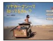
永瀬 忠志/写真と文 少年写真新聞社 2016年 ¥1400