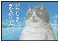
早見 和真/文 かのう かりん/絵 愛媛新聞社 2019年 ¥1800